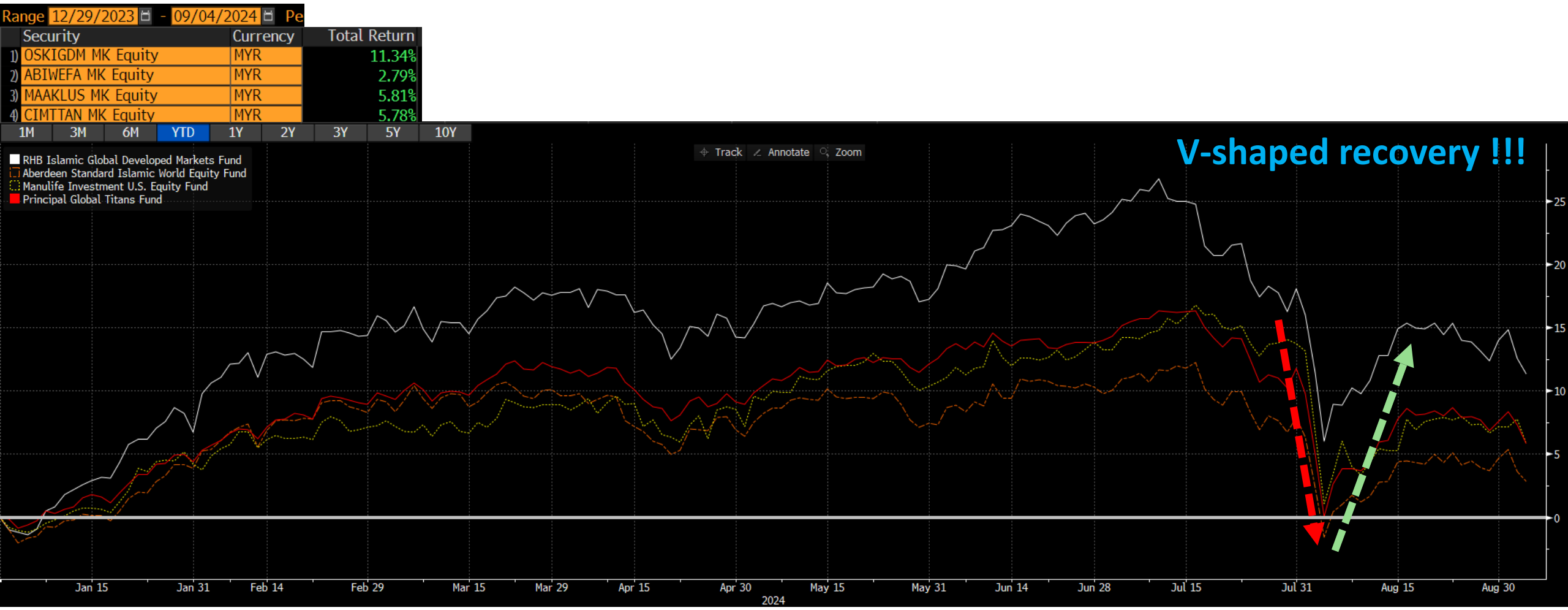
Exhibit 11: YTD Return for Selected Global UT Funds