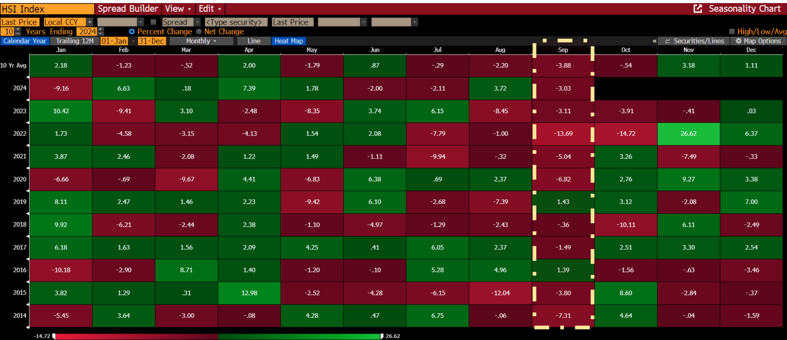
Exhibit 9: HSI 10-year return (by month)