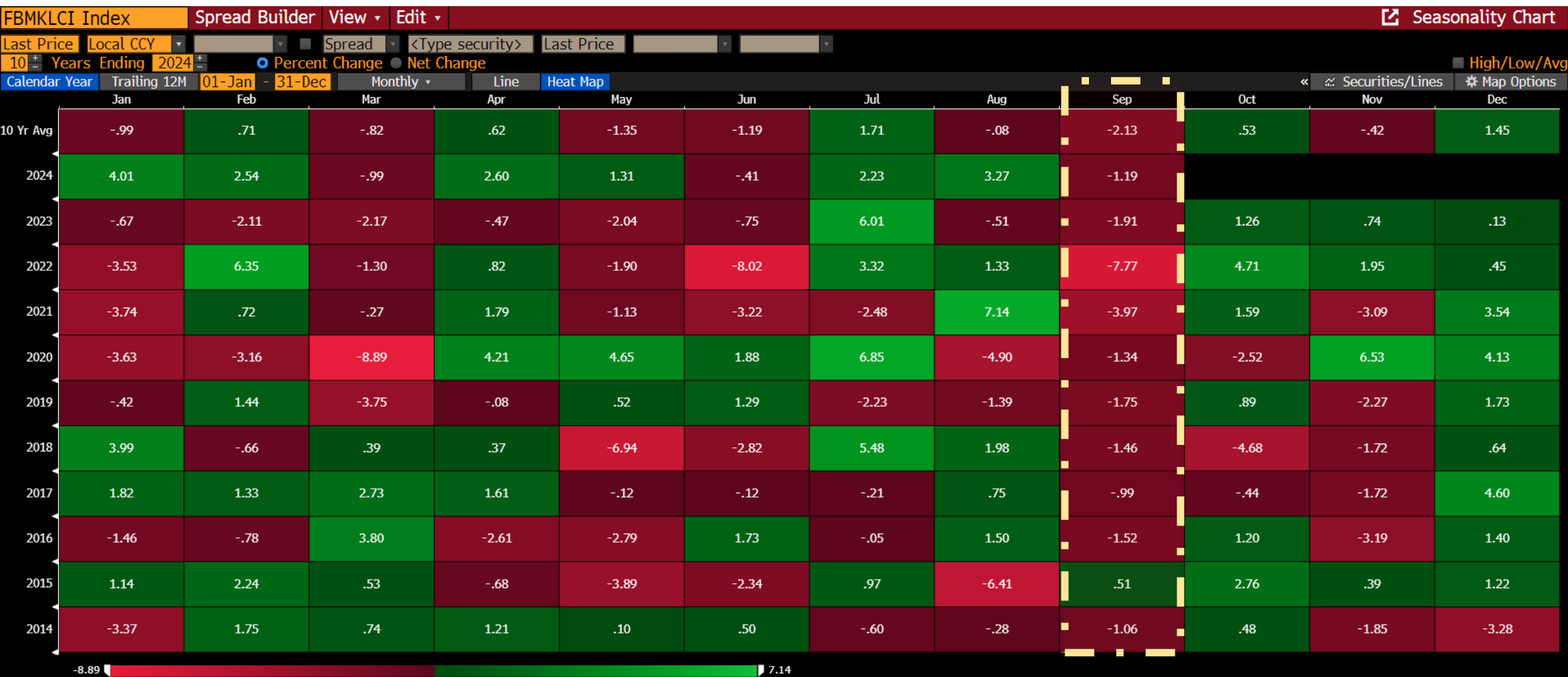
Exhibit 1: KLCI 10-year return (by month)